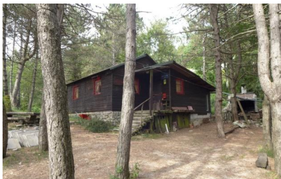
Planinarska kuća Korita